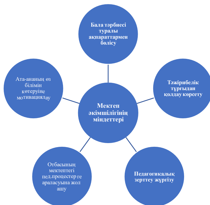
Сурет-2. Бастауыш мектеп пен отбасы арасындағы бірлесіп әрекет ету процесінде мектеп әкімшілігінің атқарар міндеттері

Бастауыш мектеп пен отбасы арасында бірлесіп әрекет ету немесе серіктестік негізінде байланыстар орнату келесідей факторларға негізделеді, бұл факторлардың әрқайсысы өз деңгейінде жүргізілмесе баланың қалыптасуына кері ықпал ету қаупі де туындауы мүмкін. Бастауыш мектеп пен отбасы бірлесіп әрекет ету факторы. Бастауыш мектеп кезеңі баланың қалыптасуында маңызды рол ойнайтын физиологиялық және психологиялық кезең болып табылады. Бұл кезеңде баламен жұмыс жасауда отбасы бөлек, бастауыш мектеп бөлек әрекет етілген жағдайда бастауыш сынып оқушысының жан-жақты кемелденіп қалыптасуына қол жеткізу мүмкіндігі жойылады. Бұл дегеніміз баланың білімін арттыруда, тәрбиеленуінде, дүниетанымының қалыптасу процесінде мектеп пен отбасы бірлесіп, бір бағытта жұмыстарды ұйымдастырудың маңыздылығы осы фактормен байланысты деген сөз. Оқушының қалыптасуында бастауыш мектеп пен отбасының педагогикалық іс-әрекеттері өзара келісілген болуы керектігі. Бұл фактор да маңызды факторлардың бірі болып табылады.